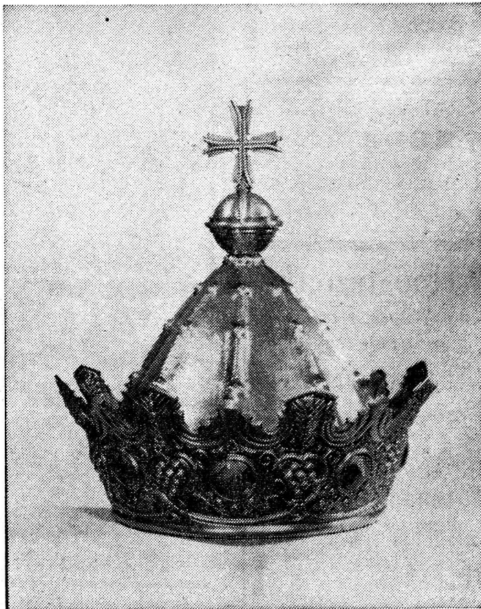
De hoog gedreven altaarkroon met emaille-versiering.